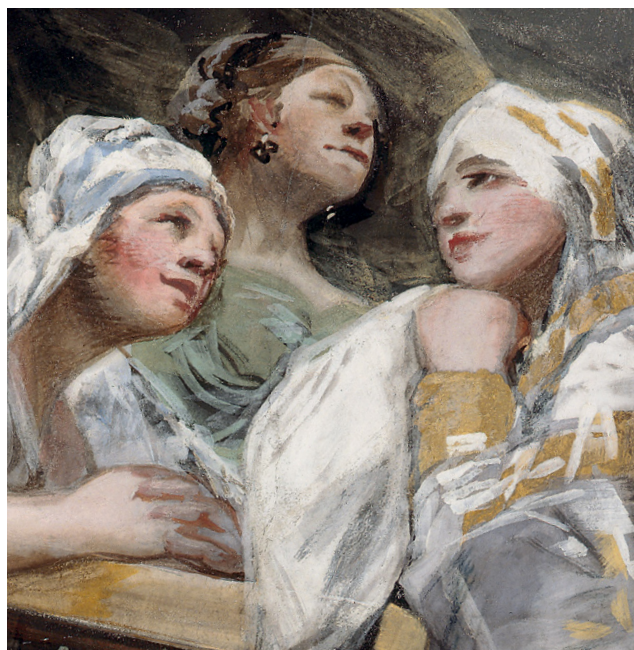
Majas al balcón. Cúpula/ Women around the balcony. Cupola

Rarely in the art world does one experience a surprise and a delight as intense as that when one enters the Ermita de San Antonio de la Florida. The sober but elegant aspect of the neo-classic building, built by order of Charles IV between 1792 and 1798 according to a design by Felipe Fontana, is transformed inside by the prodigious fresco decoration that Francisco de Goya carried out in the final year of construction.