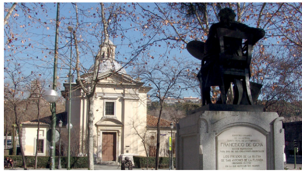
Ermita de San Antonio de la Florida

Portada: "Ángela" sosteniendo cortinajes. Luneto izquierdo