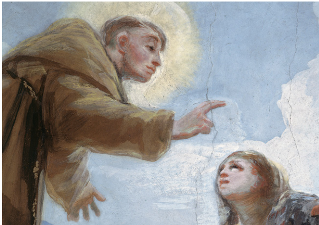
Milagro de San Antonio. Cúpula / Miracle of St. Anthony. Cupola

Pocas veces en el mundo del arte se experimenta una sorpresa y un deleite tan intensos como cuando se entra en la Ermita de San Antonio de la Florida. El aspecto sobrio y elegante del edificio neoclásico, construido por orden de Carlos IV entre 1792 y 1798 según el diseño de Felipe Fontana, se transforma en el interior por la prodigiosa decoración al fresco que Francisco de Goya realizó en este último año.