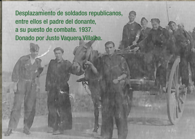
Desplazamiento de soldados republicanos, entre ellos el padre del donante, a su puesto de combate. 1937. Donado por Justo Vaquero Villalba.